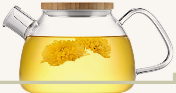
Art. Nr. TG005

Bauchige Glaskanne mit dicht verschließendem Bambus- und Aluminiumdeckel, einfach zu reinigen