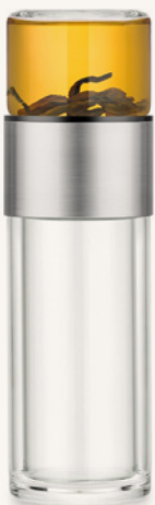
Art. Nr. TG004