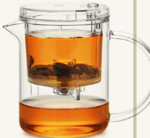
Art. Nr. TG002

Unser Tipp: Auch mehrere Personen können mit Tee aus diesem Kännchen bedient werden, indem Sie schnell in Folge mehrere Aufgüsse durchlaufen lassen. Um trotzdem intensiven Geschmack zu erhalten, erhöhen Sie die Menge des trockenen Tees im Infuser.